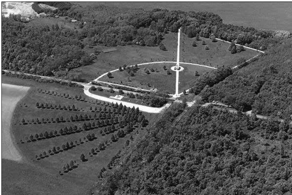
Páneurópai Piknik Emlékpark

zetet teremtett. Megszűnt a koalíció, képviselőként maradtam az önkormányzat tagja, tanácsnoki címet kaptam, de nem volt állásom. Utolsó munkahelyként egy évvel később helyezkedhettem el a Debreceni Egyetemen. Mindez azért történhetett így, mert nem láttam lehetőséget visszatérni eredeti hivatásomhoz. Az én eszményem a független újságírás,