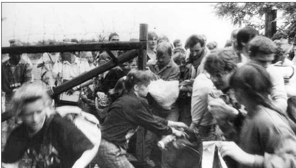
Menekülők a határon, 1989

– Nyolc-tízezer ember gyűlhetett össze, felszabadult volt a hangulat. Jókora késéssel, öt óra tájban kezdődött a meghirdetett politikai program: nyolc nyelven hangzott fel a piknik Mészáros Ferenc által megfogalmazott dekrétuma, neves magyar és külföldi közéleti személyiségek – Lichtenstein herceg osztrák parlamenti képviselő, Klaus Lange, a Páneurópa Unió osztrák elnöke, Konrád György író – szónokoltak, felhangzott Tőkés László temesvári lelkész és természetesen a debreceni és a soproni szervezők üzenete. Osztrák, nyugatnémet, angol, amerikai rádió- és tévétársaságok riporterei rögzítették az eseményeket, interjúkban szólaltatták meg a szónokokat és a résztvevő-